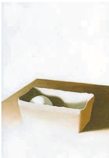
White Box Painting nr. 500.