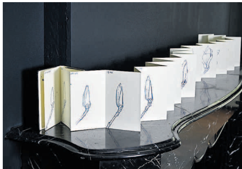
Leporello over bloei van magnolia.

hij bovendien tonale tekeningen, met zachte overgangen tussen de grijs tinten. „Voor mij zijn die twee disciplines gescheiden, al probeer ik ze tegenwoordig ook met elkaar te combineren”, zo valt te zien in de expositie.